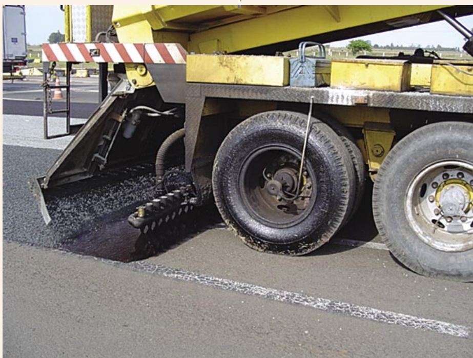
O tratamento Superficial sendo aplicado