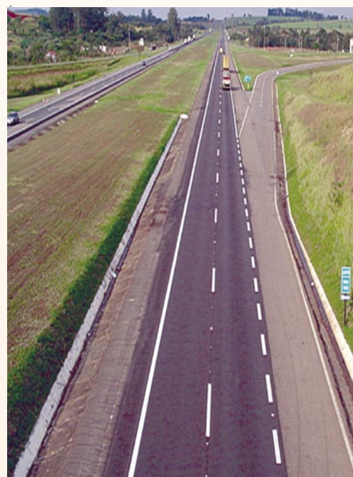
Aparência do trecho executado em Tatuí