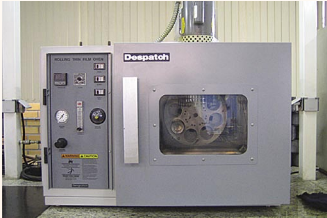
Equipamento utilizado para o ensaio de efeito do calor e do ar em película delgada rolada (RTFOT).

usinagem no ligante asfáltico. Segundo PETERSEN, 1989 (citado por BELL, WIEDER & FELLIN, 1994) muitos outros testes foram desenvolvidos para tal fim. No entanto, as melhores correlações com o envelhecimento de campo são obtidas pelos ensaios TFOT e RTFOT.