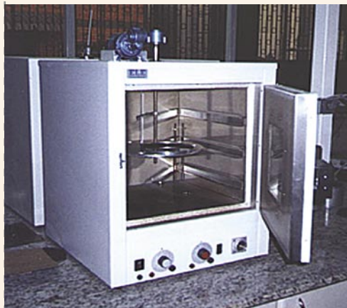
Equipamento para o ensaio de efeito do calor e do ar em película delgada (TFOT).

- Penetração mínima de 50% da penetração original (quer dizer, ter no mínimo 50% da penetração original) para ligantes classificados por penetração, caso do CAP 30/45 e CAP 50/60, e mínima de 47% para CAP 85/100.